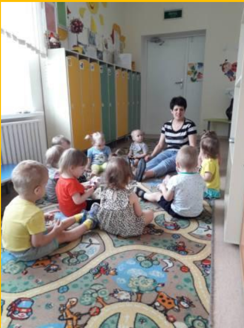
Пальчиковая гимнастика «Крот» с деревянными палочками.