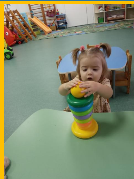
Собираем пирамиду. Помимо моторики, продолжаем учить цвет, размер, форму.