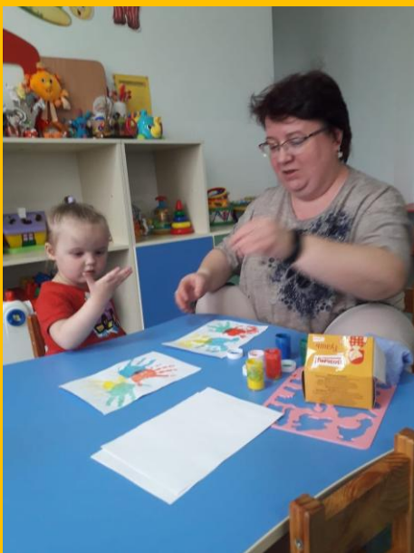
Отпечатки ладошкой. Получилась бабочка.