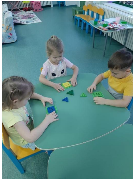
Свободная деятельность детей. Конструирование. Развитие: мелкой моторики, фантазии, внимательности.