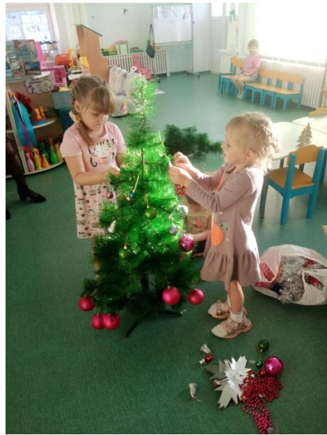
Украшение новогодней ёлки. Подготовка к предстоящему празднику.