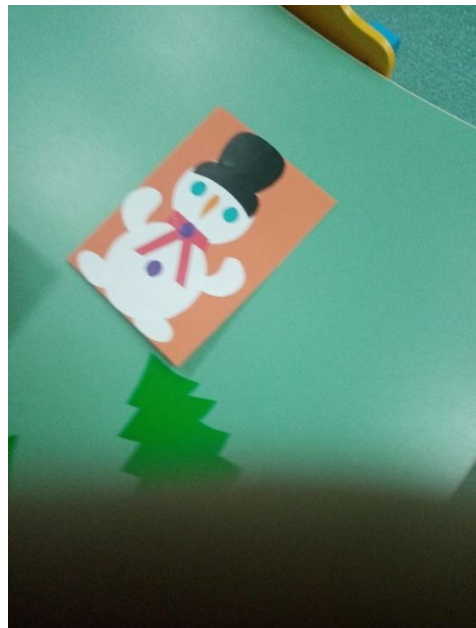
Акция «Новогодняя добрая мастерская» в создании новогодних открыток, которые будут направлены мобилизованным и военнослужащим.