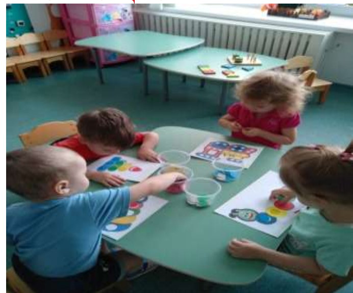
« Подбери по цвету»