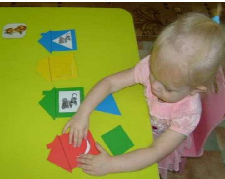
«Спрячь мышку в домик»