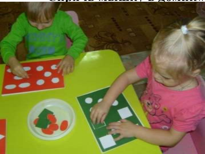
«Разложи фигуры по местам!»