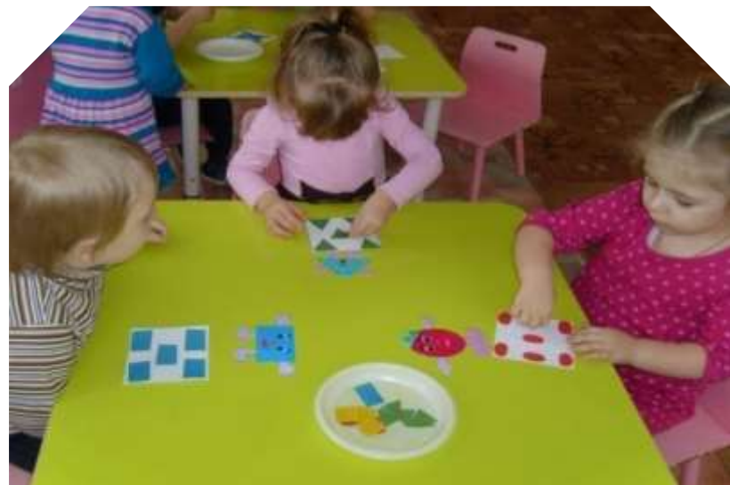
В царстве фигурок - человечков»