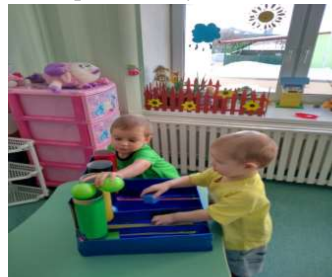
«Игра с тубусами»