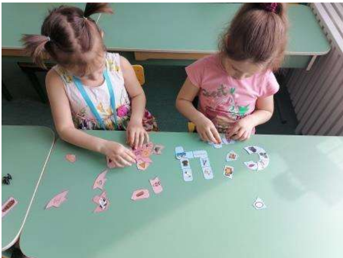
Д/И «Собери букву»