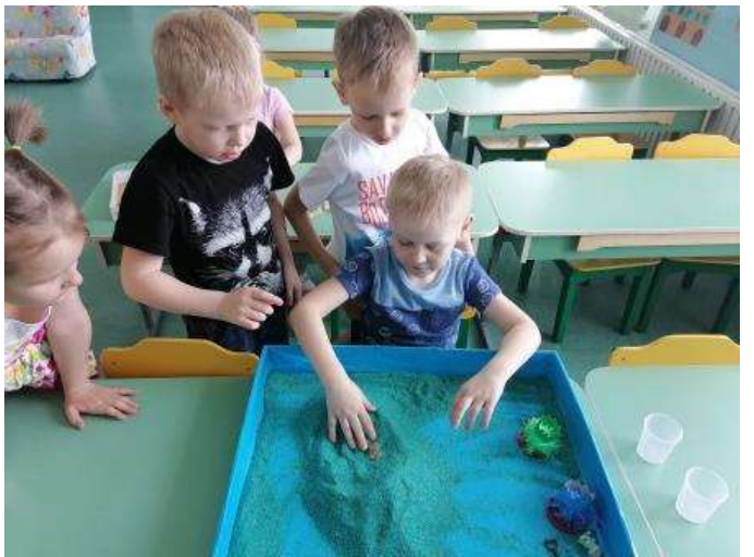
Дифференцирование мягких и твердых звуков