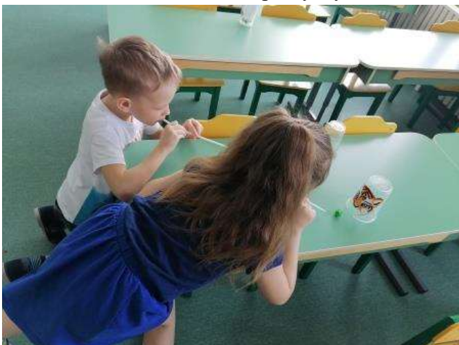
Развитие речевого дыхания