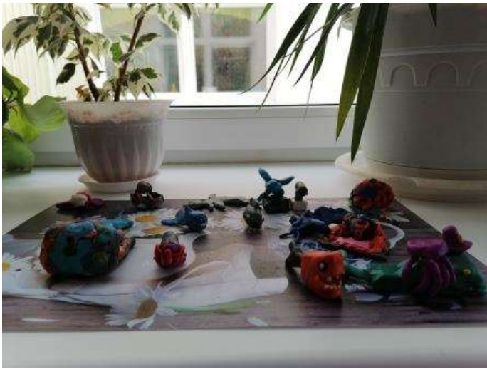
Лепка «Подводный мир»