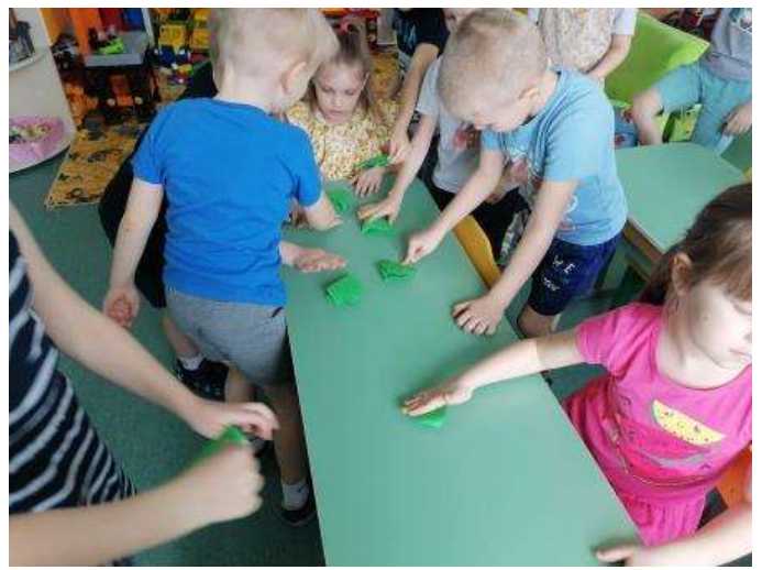
Конструирование из бумаги «Лягушка»